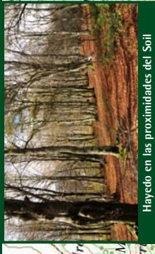
Haycock en las proximidades del Soil