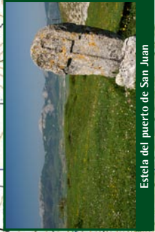
Estela del puerto de San Juan