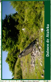
Dolmen de Ataleku