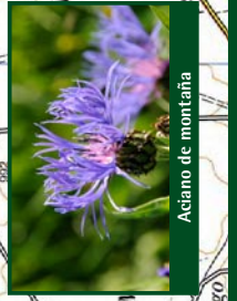
Aciano de montaña