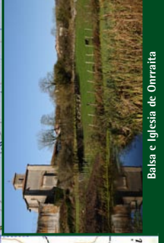
Balsa e Iglesia de Onraitia