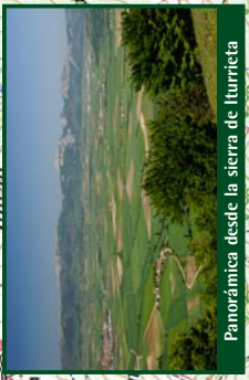
Panorámica desde la sierra de Iturrieta