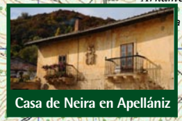
Casa de Neira en Apellaniz