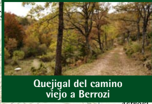
Quejigal del camino viejo a Berrozi