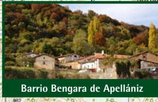
Barrio Bengara de Apellaniz