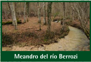
Meandro del río Berrozi