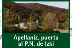
Apellaniz, puerta al P.N. de Izki