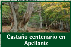
Castaño centenario en Apellaniz