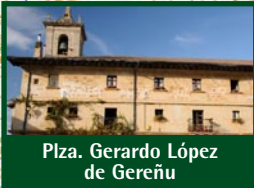
Plza. Gerardo López de Gereñu