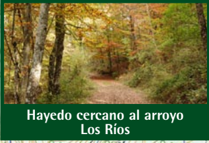
Hayedo cercano al arroyo Los Ríos